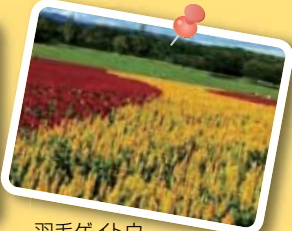
羽毛ゲイトウ [8月下旬~10月上旬]