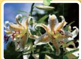
ヤマユリ [7月中旬~下旬]