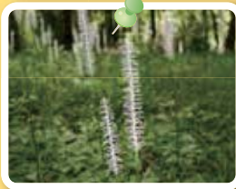
シライトソウ [5月中旬~下旬]