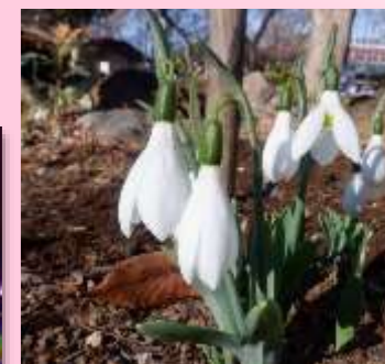
スノードロップが十数輪、植物園管理棟横で開花中