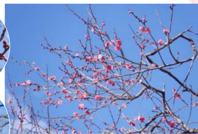
早咲きの梅 “八重寒紅”ほか約20本が咲き始め