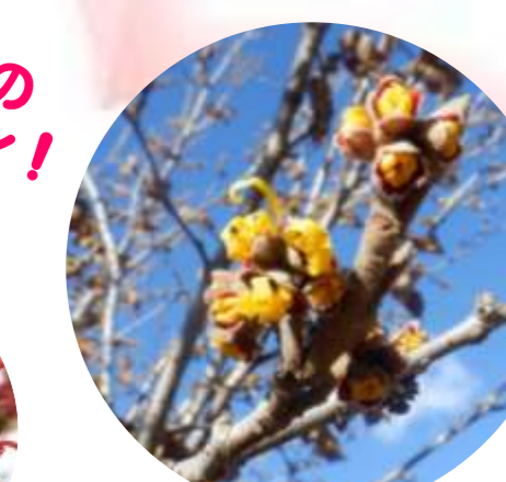
シナマンサクのつぼみがほころび中