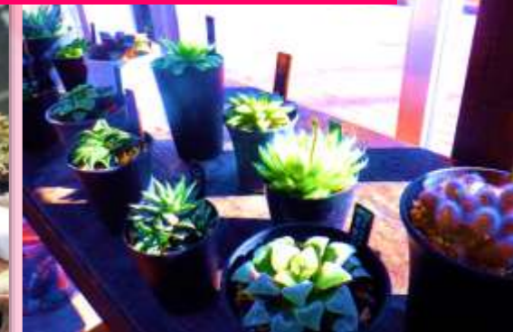
多肉やシダ植物など