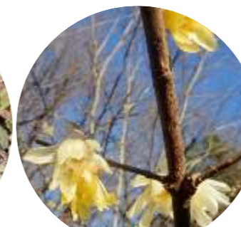
ソシンロウバイ (5本ほど) 開花中