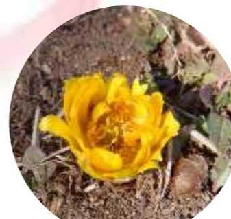
福寿草 数輪咲き始め

約120品種500本。全体的な見頃は2月中旬以降ですが、1月下旬ごろから早咲きの梅と福寿草が少しずつ咲きはじめます。