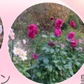
皇帝ダリア (交配種)