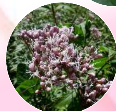
フジバカマ (園芸種)