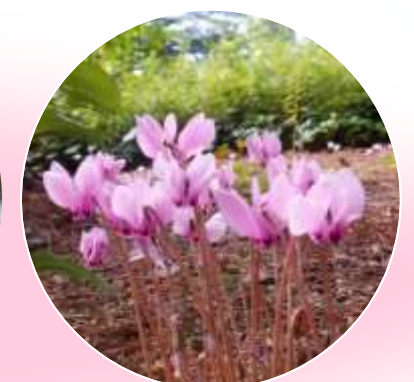
シクラメン・ ヘデリフォルム