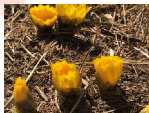
福寿草 数輪咲き始め (1/15時点)

約120品種500本。最盛期は2月中旬以降ですが、1月下旬ごろから早咲きの梅と福寿草が少しずつ咲きはじめます。