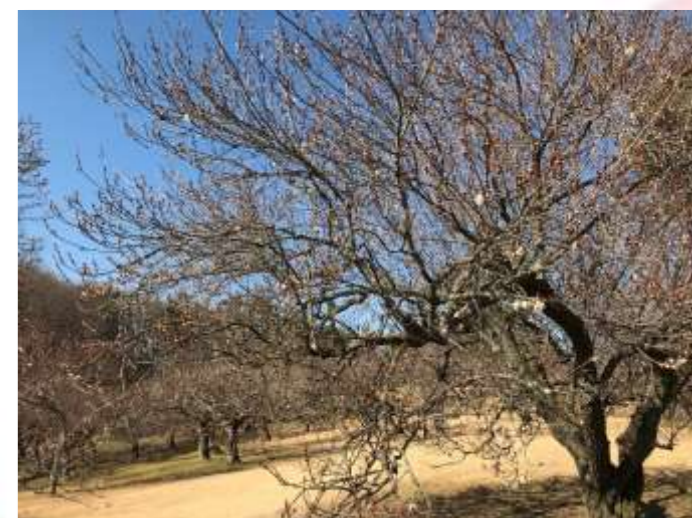
早咲きの梅 「八重寒紅」ほか約40本が咲き始め