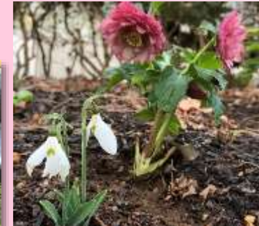
スノードロップとクリスマスローズ(各少量)も植物園管理棟横で開花中