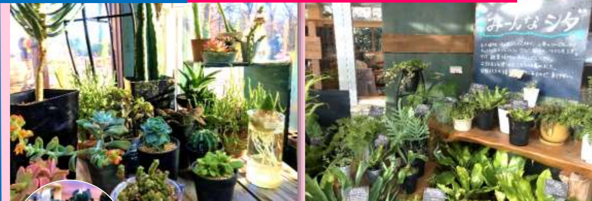
多肉やシダ植物など