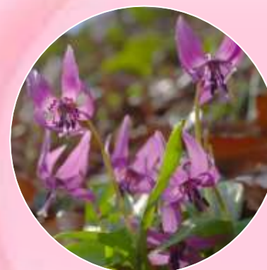
カタクリ (終了間近)