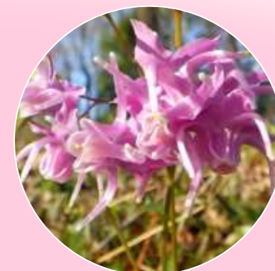
トキワイカリソウ