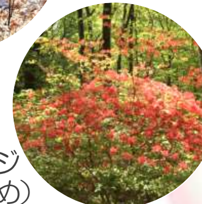
ヤマツツジ (咲きはじめ)