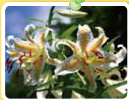
ヤマユリ [7月中旬～下旬]