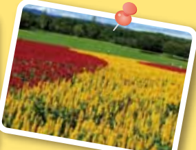
羽毛ゲイトウ [8月中旬～10月上旬]